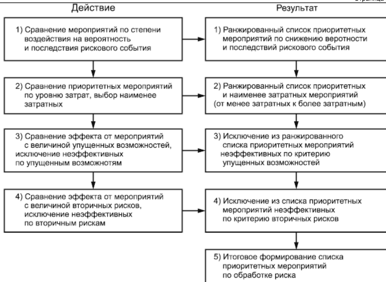
Рисунок 3 - Алгоритм формирования ранжированного списка приоритетных мероприятий по воздействию на риски организации

Для рисков, характеризующихся значительным размером потенциального ущерба, невозможно выбрать единственный наилучший метод воздействия, поскольку каждому интервалу последствий соответствует свой наилучший метод воздействия либо их комбинация. В таком случае рекомендуется рассматривать варианты с наименьшим соотношением затрат к ожидаемому эффекту на каждом интервале при условии достижения допустимого уровня риска.