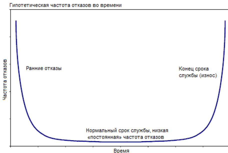
Рисунок В.1 – Модель U-образной кривой частот отказов электронных элементов

Начальная фаза часто используется изготовителем во время рабочих испытаний для того, чтобы гарантировать изготовление надежных элементов. Данные отказы обнаруживаются во время пуско-наладочных работ или ранней эксплуатации. Две последних фазы эксплуатации непосредственно относятся к старению. Существуют установленные модели и параметры для надежности электронного элемента при нормальной эксплуатации. Однако отсутствуют сопоставимые установленные модели для фазы конца срока службы. Т. к. известно, что сроки службы одинаковых элементов при сходном их применении значительно различаются, такая модель, вероятно, будет отражать специфику конкретного применения. Для оценки конца срока службы могут быть разработаны эмпирические модели, если имеется достаточно данных предыстории о рабочих характеристиках и условиях эксплуатации рассматриваемого оборудования.